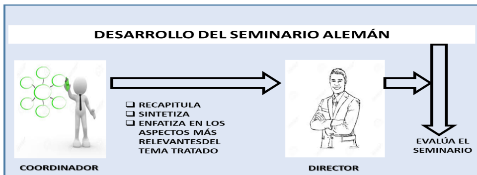
Figura 5. Cierre de la sesión de trabajo en el seminario alemán.

Finalmente, se generaron papeles de trabajo interesantes a abordar en otras sesiones puesto que de manera natural, surgieron temáticas y títulos de investigación propuestos por los mismos participantes con intenciones de abordar en trabajos de investigación a futuro. Ante esta situación, el director docente del seminario evalúa la práctica vivencial y felicita a los participantes, motivándolos a rescatar la actividad investigativa para ellos como futuros contadores públicos de la nación. En atención a ello, les propone un formato (ver figura 6). Este debe diligenciarse en la próxima sesión de clases donde se espera definir temáticas por áreas de investigación y posibles títulos investigativos a abordar, consumado en el problema de investigación.