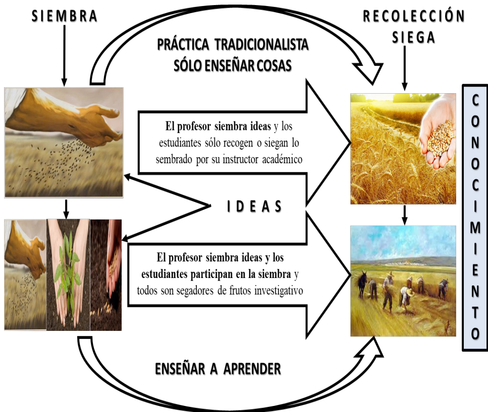
Figura 1. Enseñar a aprender Vs. enseñar cosas.

por lo cual se siembran ideas, todos participan en la siembra y todos son segadores de frutos investigativos, de esta manera se debatía la práctica tradicionalista centrada en la clase magistral donde el profesor siembra y los estudiantes sólo recogen o siegan lo sembrado por su instructor académico, esta relación se plantea en el figura 1.