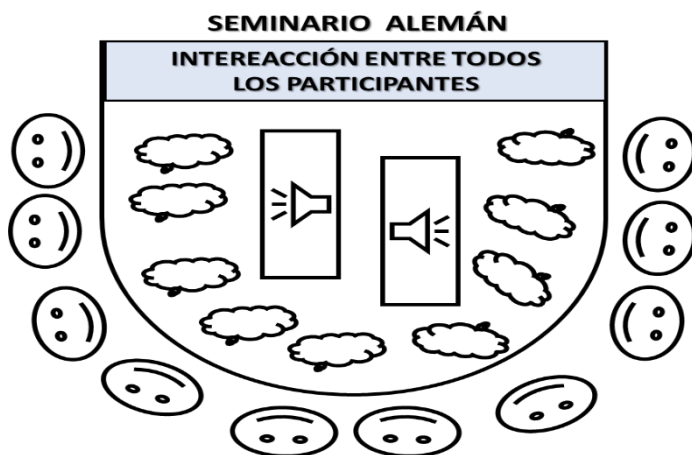
Figura 2. Ubicación de las personas en el aula. Fuente: De La Hoz, Urzola y Madera (2018)

En atención a lo antes expuesto, se considera que desde el punto de vista pedagógico, el seminario es un encuentro de iguales, tal como se expuso en la figura 1, donde cada participante tiene la elección de asumir la participación en actividades propuestas para el docente, las cuales lo inmiscuirán en el proceso formativo integral, considerando que el grupo en pleno participa según los roles designados para el desarrollo de lo planteado en el seminario alemán, siendo necesaria la identificación de funciones delineadas para cada uno de los roles designados. La figura 2, muestra desde el punto de vista de ubicación física, el por qué es necesario que el seminario de investigación se haga en tipo herradura (U).