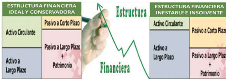
Imagen 1. Estructura financiera favorable y desfavorable