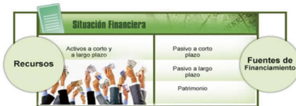
Imagen 1. Situación financiera: Balance de Recursos y Fuentes de Financiación

do en el conjunto de normas internacionales de información financiera, donde enuncia en su marco conceptual según la Fundación IFRS (2018) que los activos se deben a un hecho pasado del cual la empresa tenga control con el potencial de producir beneficios económicos. Bajo esta concepción, no se aseguran los beneficios económicos, sin embargo, la potencialidad de producirlos depende en parte de la financiación gestionada, recibida y aplicada. Es así como se referencia a las fuentes de financiamiento o financiación internas y externas que hacen parte del equilibrio de la situación financiera del negocio, donde los activos dependen de estos tipos de financiación. La imagen 1 muestra la relación entre activos, pasivo y patrimonio que revelan en conjunto la situación financiera del negocio.